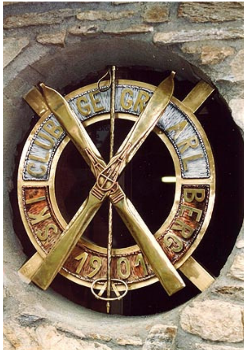
SCA – Logo verewigt