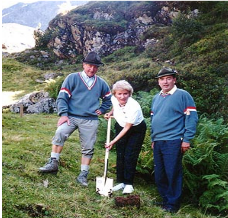
Spatenstich im Jahre 1991