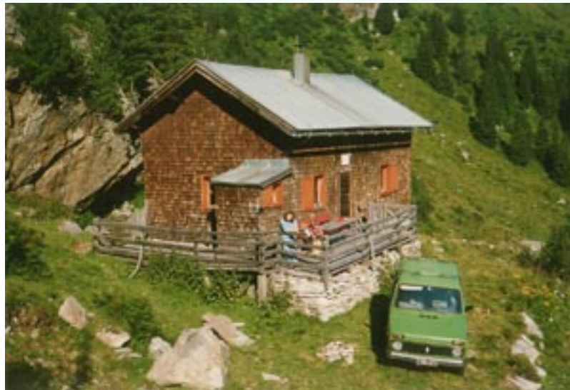
alte Skiclub – Hütte