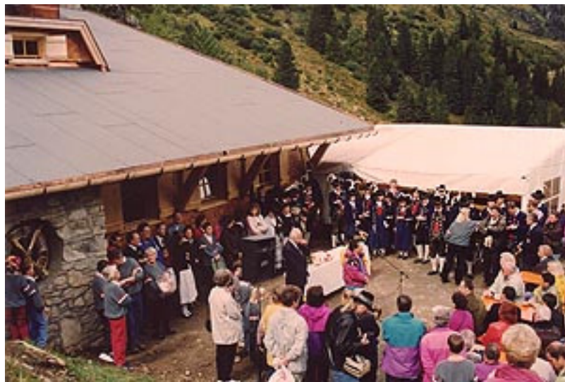
Einweihungsfeier am 10. September 1993